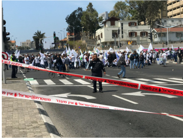
הפגנת עובדי חיפה כימיקלים, אתמול