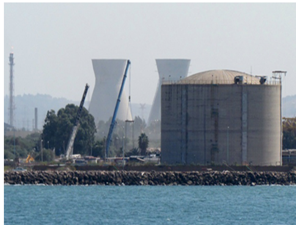
מיכל האמוניה בחיפה, ארכיון

פוראת נסאר | חדשות 2 | פורסם 29/03/17 18:14