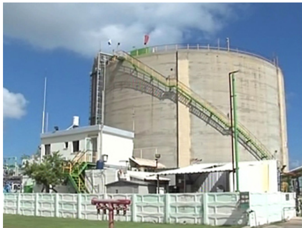
כ-416 טונות נשאר

"על מדינת ישראל להלאים מייד את מערך יבוא האמוניה, לעבור ליבוא במיכלים בטוחים ולהתחיל לדאוג לעובדים במקום לנהל משא ומתן עם פורעי החוק שמתנהלים כמו הגביר בעיירה", סיכמו בעיריית חיפה. "אנו קוראים לראש הממשלה ולשר להגנת הסביבה לפעול לטובת כמיליון מתושבי המדינה במקום לרפד את כיסם של בעלי ההון שמתגוררים מעבר לים".