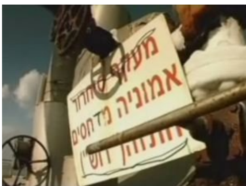
לא תעמוד בתנאים

החברה ניסתה להתחמק מההוראה לרוקן לחלוטין את המיכל עד 31 ביולי והמדינה תמכה בה - התוצאה: ביהמ"ש העליון אוסר לייבא אמוניה נוספת עד לריקונו הסופי של המיכל