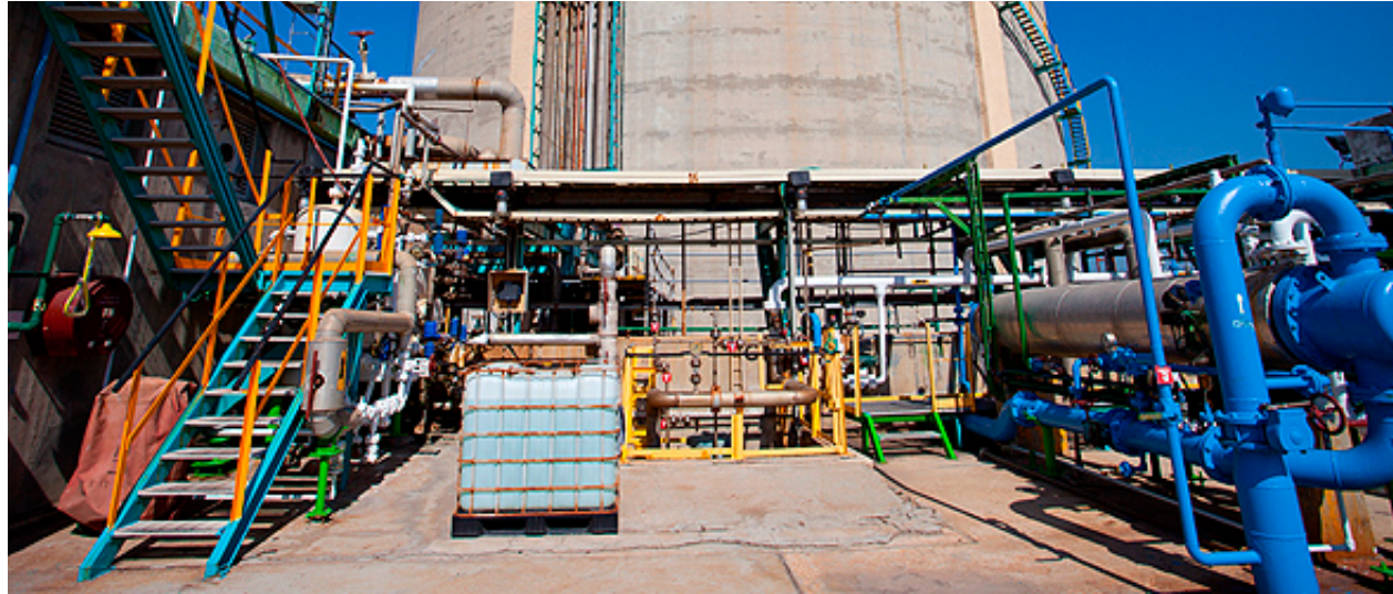
צילום: פני חמו