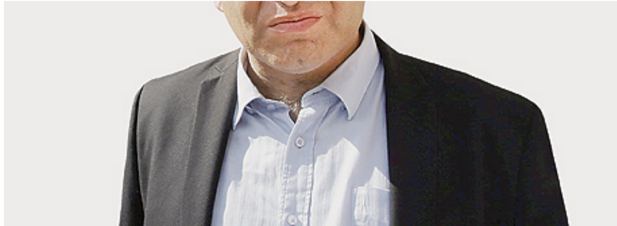
זאב אלקין, השר להגנת הסביבה