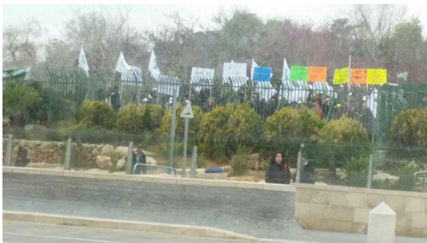
עובדים נגד הפיטורים הצפויים

בזמן הדיון בוועדה המשטרה עיכבה את האוטובוסים של עובדי חיפה כימיקלים בניסיון למנוע את הפגנת העובדים שתוכננה מול הכנסת. העובדים שהגיעו בכל זאת, הפגינו בגבעת ההפגנות. מוועד העובדים נמסר: "אנחנו מבקשים ממשטרת ישראל לאפשר לנו להפגין ולהילחם על הפרנסה שלנו".